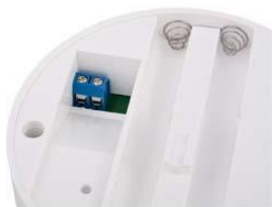
Схема ИП 212-43